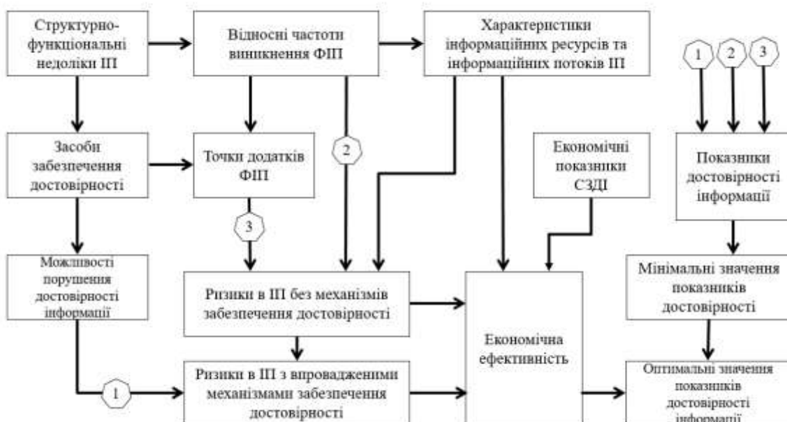
Рис. 1. Загальна модель контролю показників достовірності інформації в ІП